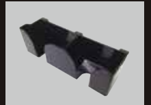
名刺製品受(標準搭載)