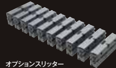
オプションスリッター

給紙部フルオープン 給紙部がフルオープンします。邪魔なものがないので紙詰まり除去が簡単です。