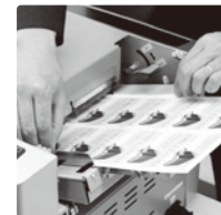
用紙サイドガイド