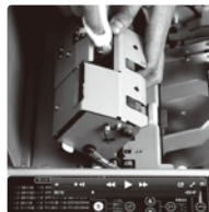
加圧ユニットガタ