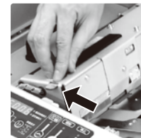
給紙ユニットのロックツメ