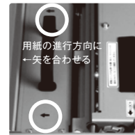
加圧ユニット取り付け向き