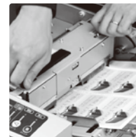
給紙ユニット固定つまみねじ