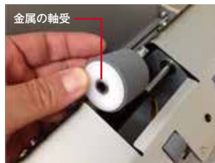
金属の軸受があるほうが 手前になるよう取り付けます。