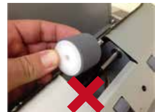
白いプラスチックの面が手前になると 給紙しません。