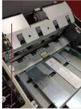
給紙ユニット (写真はPCM-15のもので)