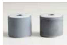
新品 摩耗のため 交換したもの

「ピックアップローラーASSY」は給紙のための消耗品です。 ゴムの表面がツルツルになって給紙しにくくなったら交換が必要です。 お客様ご自身で簡単に交換していただけます。